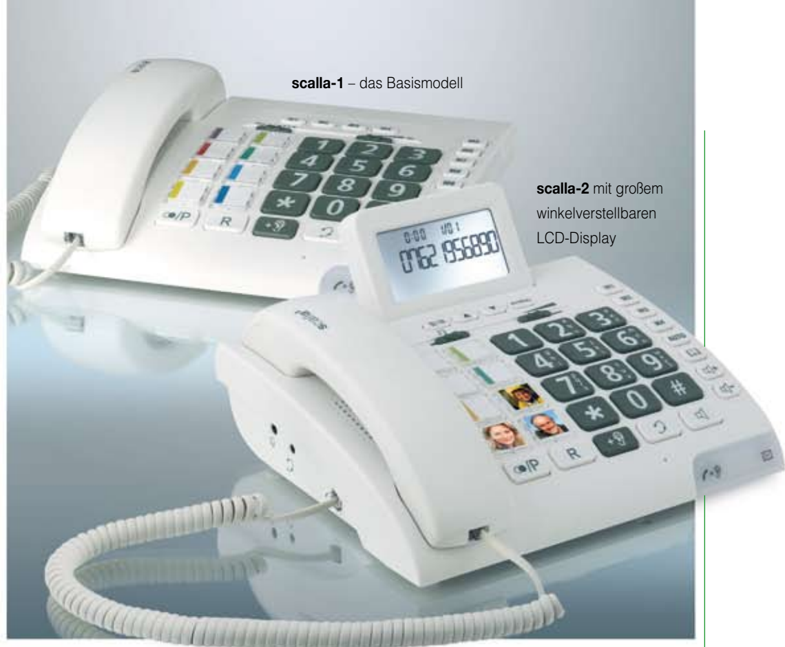
scalla-1 – das Basismodell

Mit der Einbettung der Kurzwahl-Referenzliste in die Unterseite des Hörers hat der Bediener zum Beispiel die Möglichkeit, die Liste nah an die Augen zu führen, ohne sich zum Gerät herabbeugen zu müssen.