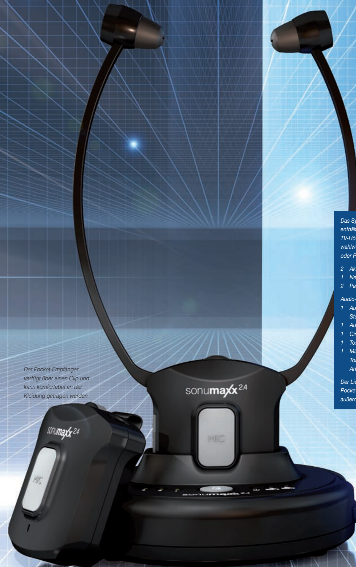
Der Pocket-Empfänger verfügt über einen Clip und kann komfortabel an der Kleidung getragen werden.

Das System-Set »sonumaxx-2.4« enthält ein anschlussfertiges TV-Hörsystem mit einem Sender und wahlweise einem Kinnbügel-Empfänger oder Pocket-Empfänger mit Clip sowie